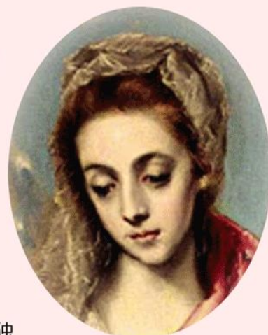
グレコ 聖母マリア

ギリシャのクレタ島で生まれたグレコ は、イタリアで絵を学んだ後、スペイン で宮廷画家を志したが、落選。その後は独 特なスタイルの人物描写で活躍、有名に。