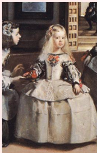
ベラスケス マルガリータ

マネをして「画家中の画家」と言わしめ たスペインを代表する画家。精緻な描 写と画面の構成力の見事さは他の追 随を許さない。その魅力に迫る。