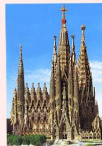
ピカソ アヴィニヨンの娘 ガウディ サグラダ教会