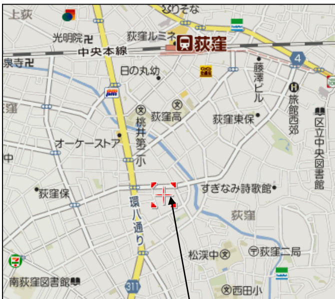
会場：荻窪地域区民センター

1936 東京生まれ 1960 東京大学文学部美学美術史学科卒 日本経済新聞社入社・美術関連の仕事で世界を取材 1997 同社を退社 彩美社を設立 代表取締役役に就任 2008 NPO 法人美術教育支援協会・理事長に就任 現在 美術評論家